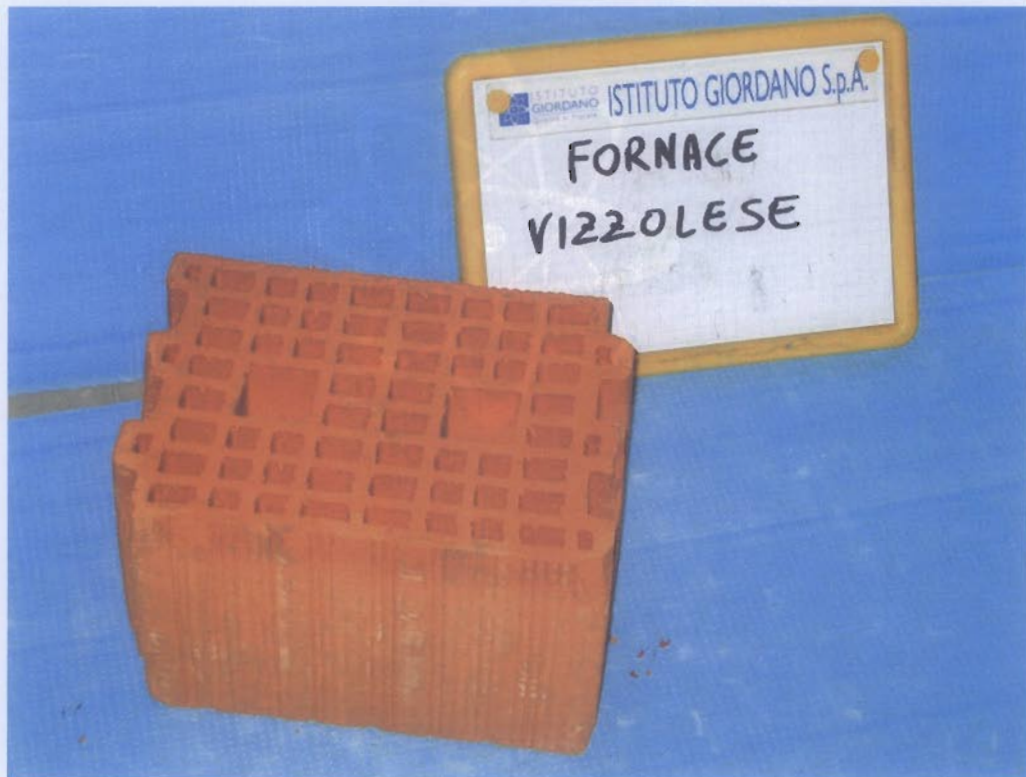
Fotografia del campione sottoposto a prova.

Resistenza minima rilevata: f_{bi \text{ minima}} = 10,2 \text{ N/mm}^2